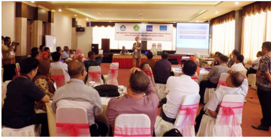
Peserta TOT SPM DIKDas yang tengah mendengarkan materi dari salah satu konsultan Pengembangan Kapasitas Penerapan, senin ( 14/ 03 ).

Home » Metro Luwuk » PKP SPM Dikdas Region III Gelar TOT